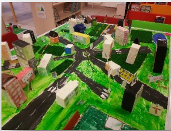
Représentation du quartier dans lequel les élèves aimeraient vivre. (Ecole de la Fraternité à Ambilly)

OBJECTIF : Sensibiliser les élèves aux enjeux d'urbanisme liés au développement durable et impulser de nouvelles pratiques