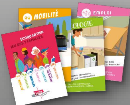
La conception de l'écoquartier est axée selon 7 objectifs forts qui ont été déclinés sous la forme d'un jeu des 7 familles. Ce jeu de cartes propose des pistes aux élèves pour rendre un quartier aussi « idéal » que possible.

C'est un projet d'aménagement urbain conçu dans une perspective de développement durable, qui doit répondre à plusieurs objectifs : réduire l'impact sur l'environnement, favoriser le développement économique, proposer de nouvelles habitudes de déplacement, garantir une bonne qualité de vie et permettre la mixité et l'intégration sociale.